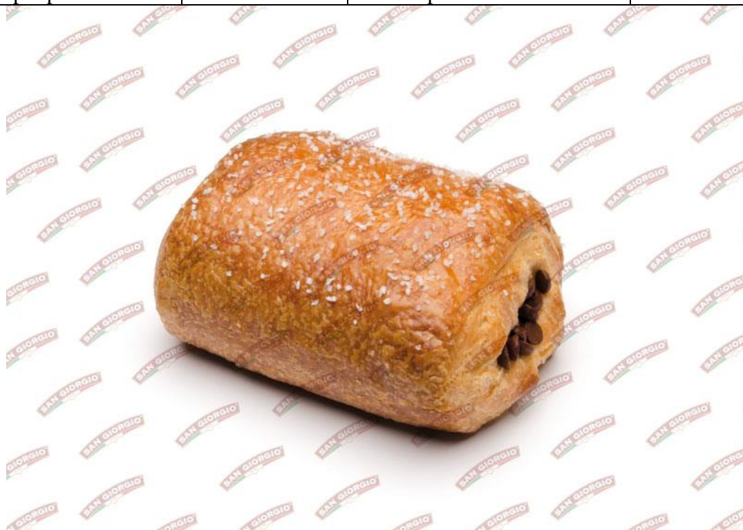
La foto è solo a scopo puramente illustrativo