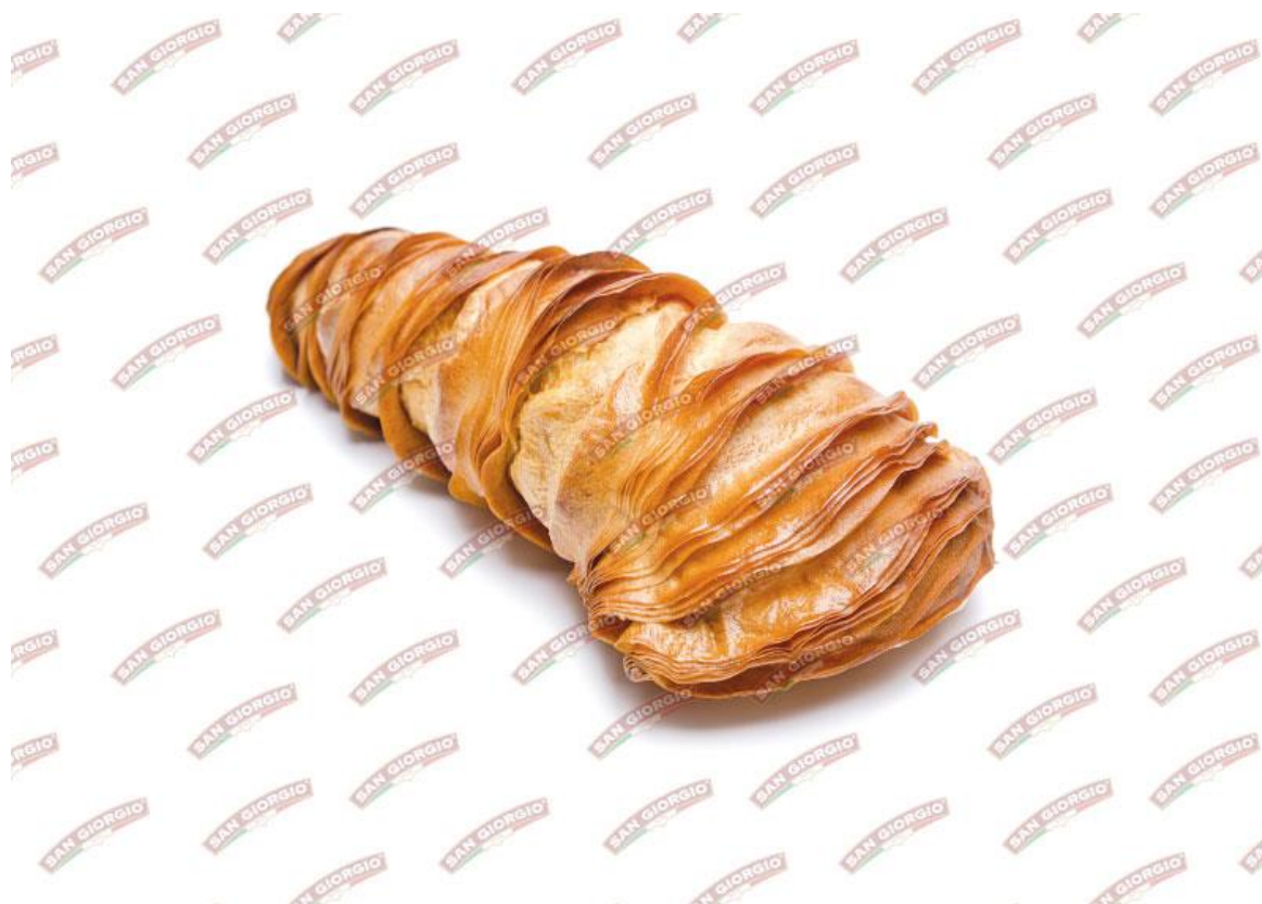
La foto è solo a scopo puramente illustrativo